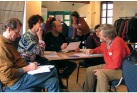
45 projecthouders volgen een vorming dank zij « Stap voor stap naar een houdbare ontwikkeling » en Alter R&I