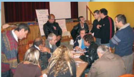
Werkvergadering geanimeerd door de grensoverschrijdende panelleden in de Karpaten. November 2006.