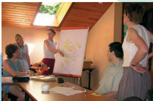
Het team van de Stichting volop aan het brainstormen.