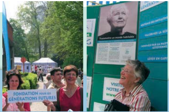
De Stichting komt het publiek tegemoet tijdens publieke manifestaties.