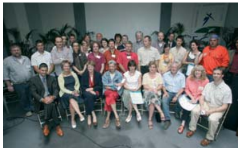
De 20 laureaten van de oproep « Stap voor stap », lichter 2006, op 20 juni in Brussel.

Talrijke lokale initiatieven bewijzen dat het mogelijk is om projecten te sturen in de richting van een meer duurzame ontwikkeling. Dankzij deze oproep ontving en analyseerde de Stichting in 2006 maar liefst 112 dossiers van kandidaten. Na een eerste selectie werden 45 kandidaten uitgenodigd voor een driedaagse vormingscursus, om hen te helpen hun project te verbeteren. Na de eindselectie kregen 20 kandidaten begeleiding en een financiële ondersteuning. De selectiecriteria: duurzaamheid van de voorgestelde projecten, hun vernieuwende karakter en de mogelijkheid om de initiatieven voor te zetten in de tijd.