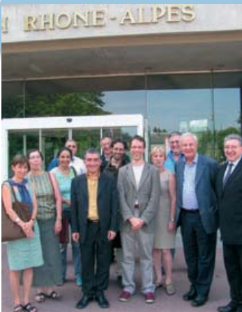
Lyon, Frankrijk, juni 2006. Het Steering Committee van het Europese burgerpanel wordt verwelkomd door de regio Rhône-Alpes.