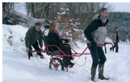
Mindervalide maar daarom niet minder geïnteresseerd in de natuur, dankzij Nature pour tous, laureaat 2006.

De vereniging Natagora zet zich in voor de bescherming, het behoud, het herstel en de ontwikkeling van de natuur in Brussel en Wallonië. Met het project Nature pour tous wil de vereniging de natuurlijke reserves en de natuurexploratie toegankelijk maken voor mensen met een lichamelijke of mentale handicap. Om dit te realiseren is een netwerk van gespecialiseerde medewerkers nodig. De vereniging wil met de steun van de Stichting het netwerk vergroten voor het in bruikleen geven van aangepast materiaal.