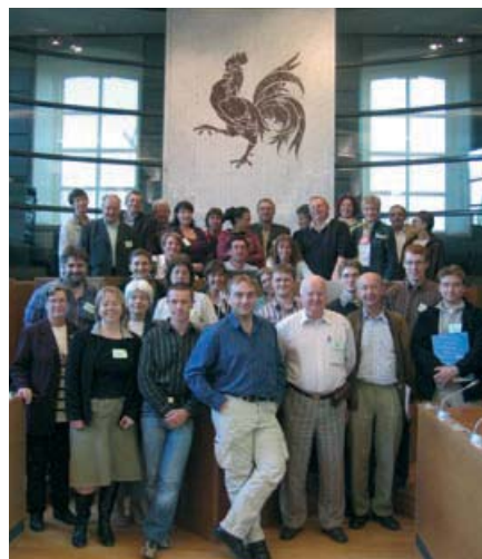
Gewone mensen in een wel buitengewoon gebeuren, willekeurig gekozen in de stad en op het platteland, konden zich een duidelijke, beargumenteerde mening vormen over de toekomst van het plattelandleven in Wallonië.

Het panel kwam tot stand in samenwerking met Trame cvba, expert op het gebied van plattelandontwikkeling, en kon rekenen op de actieve steun van de minister van Landbouw, Platteland en Milieu en van de Algemene Directie voor Landbouw van het Waalse Gewest.