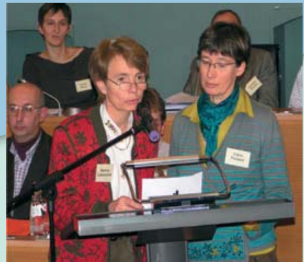
Parlement van het Waalse Gewest december 2006: De panelleden bieden hun conclusies aan over de toekomst van de landelijke gebieden aan de betrokken overheden en instellingen.