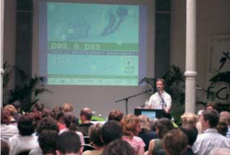
Proclamatie van de 20 laureaten van de projectoproep, juni 2006.