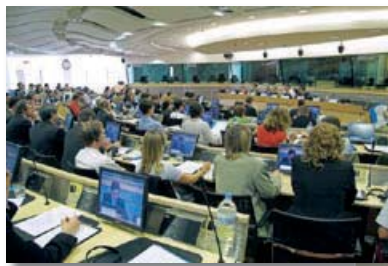
Officiële lancering van het Europees Burgerpanel in de vergaderzaal van het Comité van de Regio's van de Europese Unie.

Tot de partners op Europees niveau behoren de Bernheim Stichting, Carnegie UK Trust, de Charles L. Mayer Stichting, de Evens Stichting, de Fondation de France, de Koning Boudewijnstichting, J. Rowntree Ch. Trust en NEF. Daarbij komen nog de DG Onderwijs en Cultuur van de Europese Commissie en het Comité van de Regio's van de Europese Unie.