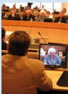
Mariann Fischer Boel, Eurocommissaris voor Landbouw en Plattelandsontwikkeling (bovenaan en op het scherm), luistert aandachtig naar de aanbevelingen van het Panel.