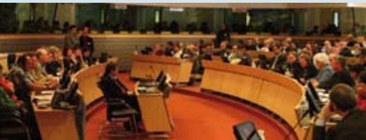
De rollen omgekeerd: de burgers-panelleden richten zich van op de tribunes tot de hoogste EU-vertegenwoordigers voor plattelandsbeleid tijdens hun zitting. Meer dan een symbool...

Het Europese panel rond de toekomst van het platteland, opgestart in mei 2006, liep in april 2007 ten einde. Nadat de panelleden in de verschillende landen hun aanbevelingen voor elke streek hadden gemaakt, kwamen ze op 30/31 maart en 1 april 2007 samen in Brussel om een gemeenschappelijk Europees advies uit te spreken.