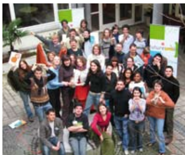
100% geconcentreerde deelnemers maar toch een keitoffe sfeer: de vormingssessies van FutureSmile in Mechelen en Brussel.

In mei '68 prijkte op ontelbare muren de slogan "De verbeelding aan de macht!". 40 jaar later is die oproep nog steeds brandend actueel. Future Smile werd in 2007 gelanceerd door de Stichting voor de Toekomstige Generaties, en wil een bijdrage leveren aan deze gulle uitnodiging tot creativiteit.