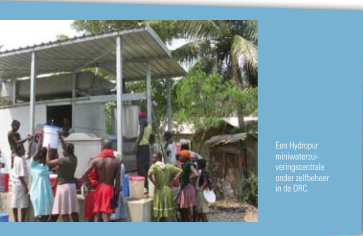
Een Hydropur miniwaterzuierverschikingscentrale onder zelfbeheer in de DRK.