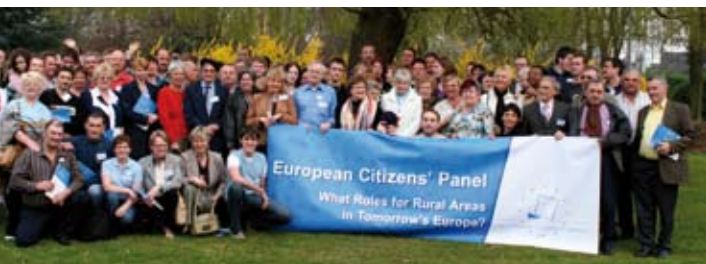
De 87 panelleden van het Europees Burgerpanel in besloten vergadering.

In 2006-2007 waagde de Stichting zich op een (nog) ambitieuzer terrein. Onder de vorm van een burgerpanel werd de toekomst van de landelijke gebieden in Europa onder de loep genomen: een moeilijk dossier, want het betreft op directe manier 90% van het Europese grondgebied, 50% van de bevolking en de helft van het Europese budget, uitgegeven aan landbouw.