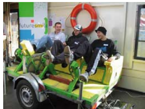
De geluidsinstallatie op de Future Smile Expo werkte op elektriciteit, opgewekt door een vreemde soort machine...

In maart 2007 gingen twee vormingsweekenden door voor de initiatiefnemers van de projecten: één in Mechelen voor de Nederlandstaligen, een tweede in Brussel voor de Franstaligen. 88 jongeren namen hieraan deel.