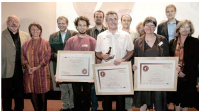
Altech – Hydropur, laureaat 2007 van de Grote Prijs voor de Toekomstige Generaties, samen met de genomineerden en de juryleden.

Sinds haar oprichting doet de Stichting geregeld 'oproepen tot initiatieven'. Het doel is kleine projecten (met een groot potentieel!) gericht op duurzame ontwikkeling te ondersteunen.