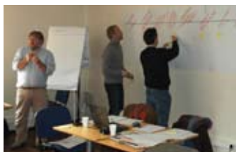
Van diagnose naar burgerparticipatie: methodologische steun van de Agenda Iris 21.

Drie partners vervulde de groep die werkte rond de 'Agenda Iris 21': de Minister voor Milieu van het Brussels Hoofdstedelijk Gewest, Brussel-Leefmilieu/BIM en de Vereniging voor Steden en Gemeenten van Brussel (VSGB).