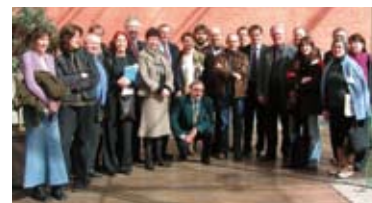
De burgers-panelleden na hun uiteenzetting voor de Commissie Platteland en Milieu van het Waalse Parlement, samen met de Voorzitter van de Commissie, Robert Meureau, en de Minister van Landbouw en Landelijke Aangelegenheden, Benoît Lutgen.

Op 20 maart werden de panelleden uitgenodigd om hun aanbevelingen voor te stellen aan de Commissie voor Milieu en Platteland van het Waalse Parlement. Diezelfde maand verdedigden ze hun standpunt voor een forum van 150 personen, die op een of andere manier bij het plattelandsleven in het Waalse Gewest betrokken zijn, tijdens een bijeenkomst in La Bruyère (provincie Namen). In oktober stelden ze hun resultaten ook voor aan een forum van Europese en Chinese experts in plattelandskwesties op een bijeenkomst in Gembloux in het kader van het 2 de China-Europa Forum. Nog steeds in oktober ontmoetten ze Waalse vertegenwoordigers van de varkens- en gevogeltesector, op vraag van deze laatste.