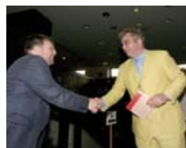
Een 150-tal mensen uit alle uithoeken woonden de ceremonie bij, in aanwezigheid van Z.K.H. Prins Laurent.

De volgende editie van de Grote Prijs vindt plaats in 2008 en richt zich tot alle Belgische projecten.